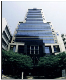
天神クリスタルビル正面 ( 超広角レンズにて撮影しております )